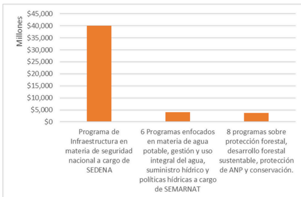
Figura 2. Comparación entre programas del AT16.