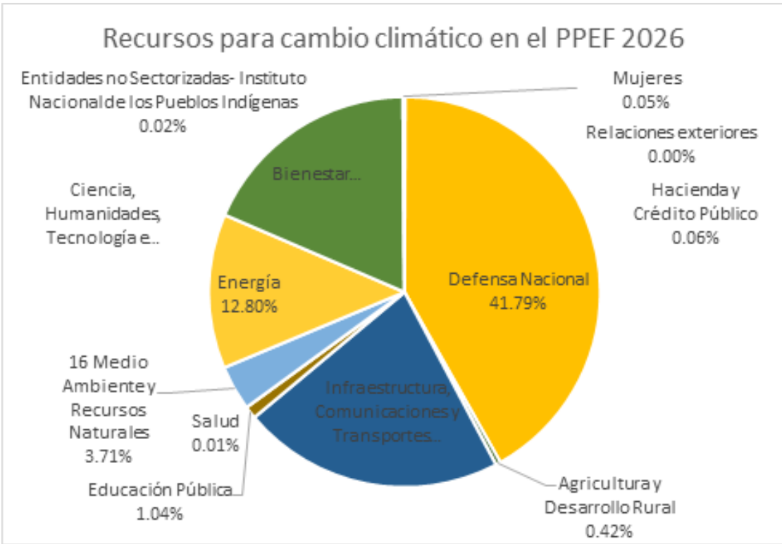
Figura 3. Distribución del Anexo 16 por ramo. Recursos para la adaptación y mitigación del cambio climático.

En la siguiente tabla y gráfica se muestra la distribución: